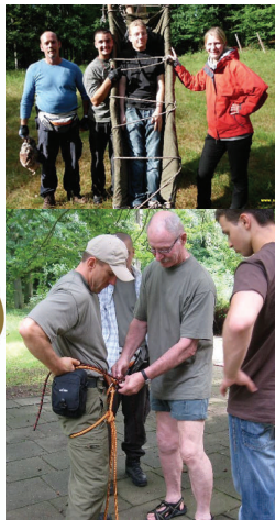
Mitten im Wald am Werbellinsee